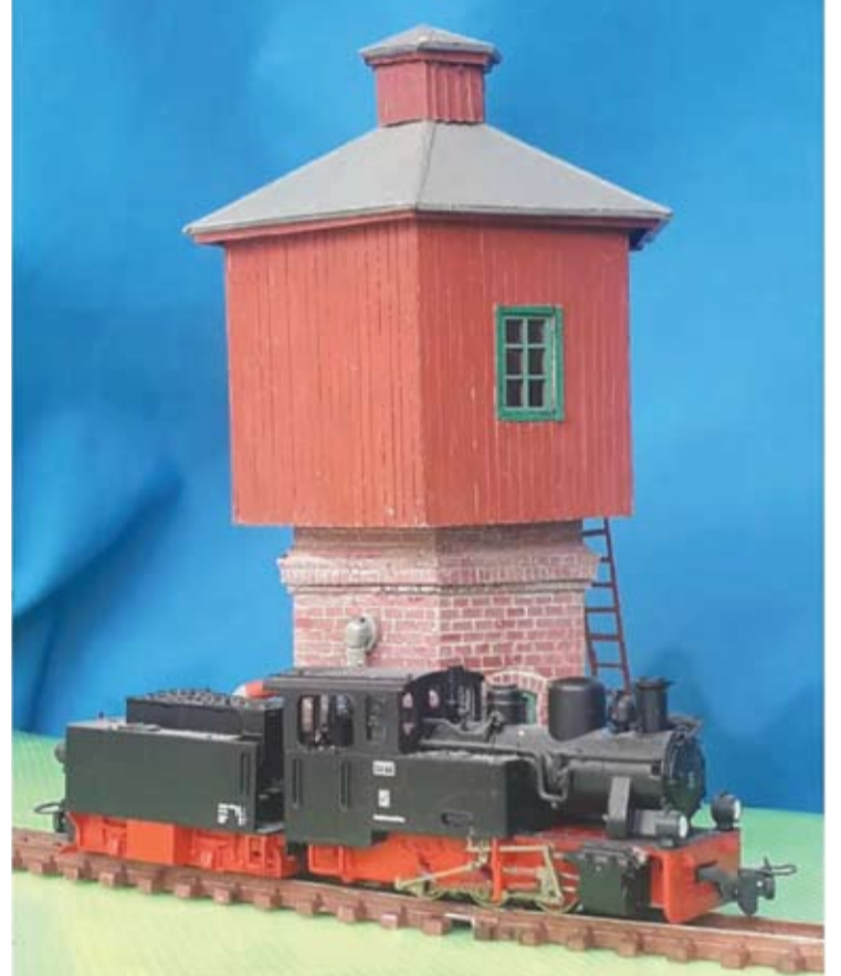
Anykščių geležinkelio stoties vandentiekio bokštas.