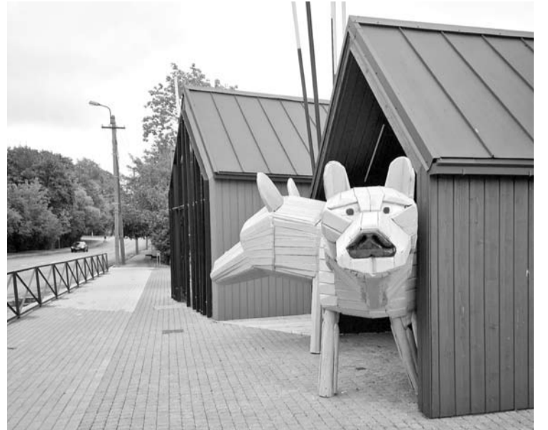
Mediniai vilkai kol kas vieninteliai šių namukų rezidentai.

Priminsime, kad už Tilto gatvės komplekse suteiktas patal-