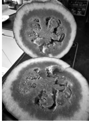
Anykščiuose užaugintas arbūzas kur kas saldesnis nei iš prekybos tinklų.

Vidmantas ŠMIGELSKAS vidmantas.s@anyksta.lt